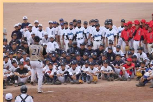
◎野球教室 (元プロ野球選手による)

本大会を通じて、同じ離島の球児たちと交流を図り、普段その技術を間近で見る機会が少ない元プロ野球選手の指導を受け、青少年の健全育成と離島間交流の推進のため寄附金を活用しました。