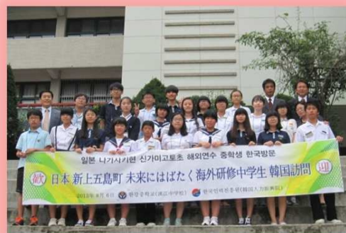
◎現地学生との交流