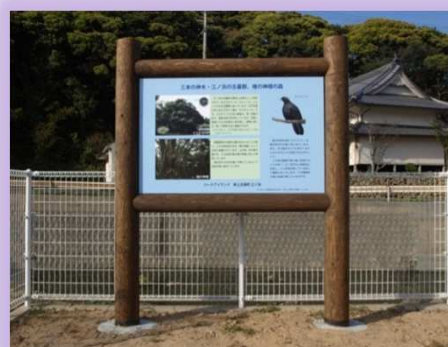
◎設置した文化的景観関連案内板