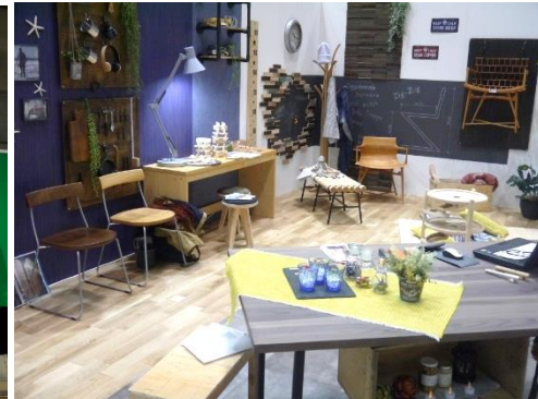
※写真は「ウッドデザイン賞2017」エコプロ2017の表彰式、展示の様子